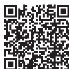
ABB Zenith Controls, Inc. 305 Gregson Drive Cary, NC 27511 24-hour support: ABB Technical Services +1 (800) 637-1738