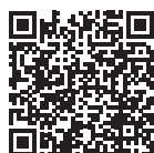
ABB Zenith Controls, Inc. 305 Gregson Drive Cary, NC 27511 24-hour support: ABB Technical Services +1 (800) 637-1738