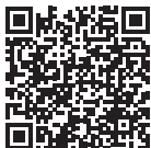
ABB Zenith Controls, Inc. 305 Gregson Drive Cary, NC 27511 24-hour support: ABB Technical Services +1 (800) 637-1738