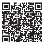
ABB Zenith Controls, Inc. 305 Gregson Drive Cary, NC 27511 24-hour support: ABB Technical Services +1 (800) 637-1738

© Copyright 2019 ABB. Todos los derechos reservados. Información sujeta a cambios sin previo aviso.